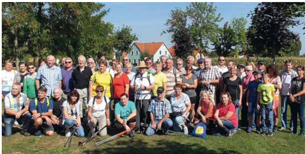
„Wandern mit andern“ - tut gut! Ein Gruppenfoto vor dem Start der Wanderung von Teich zu Teich.