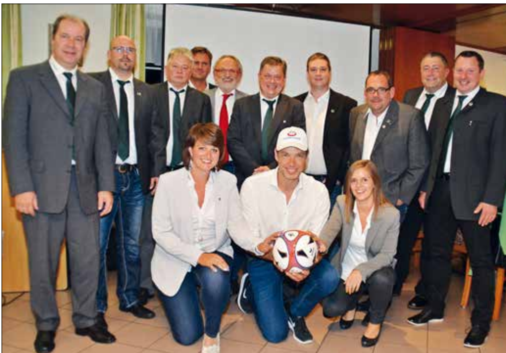
Der Vorstand des SV Klement Haitzendorf mit Ehrengast Thomas Sykora bei der „70er“-Jubiläumsfeier.

Der SV Klement Haitzendorf möchte hier noch einmal die angebotene Möglichkeit nutzen, um sich bei allen Funktionären, Helfern, Gönnern, Fans, für ihre Unterstützung zu bedanken.