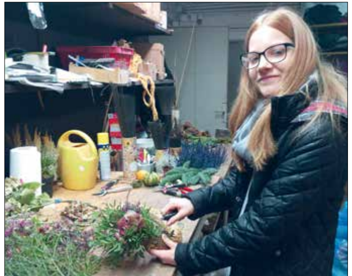
Die Schülerinnen und Schüler der NMS Grafenegg werden durch die Berufsorientierung und Berufsinformation auf das Arbeitsleben vorbereitet und konnten dabei in zahlreiche Lehrberufe „hinein schnuppern“.