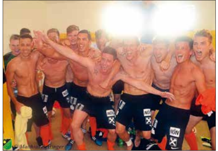
So jubeln erfolgreiche Kicker! Im Bild der damalige Tabellenführer SV Klement Haitzendorf in der 1. Fußballlandesliga. Aus der „grauen Maus“ vom Frühjahr wurde ein kraftvoller Tiger im Herbstdurchgang, der nun auf dem 5. Tabellenrang überwintert. Im Frühjahr 2017 ist für Spannung gesorgt.