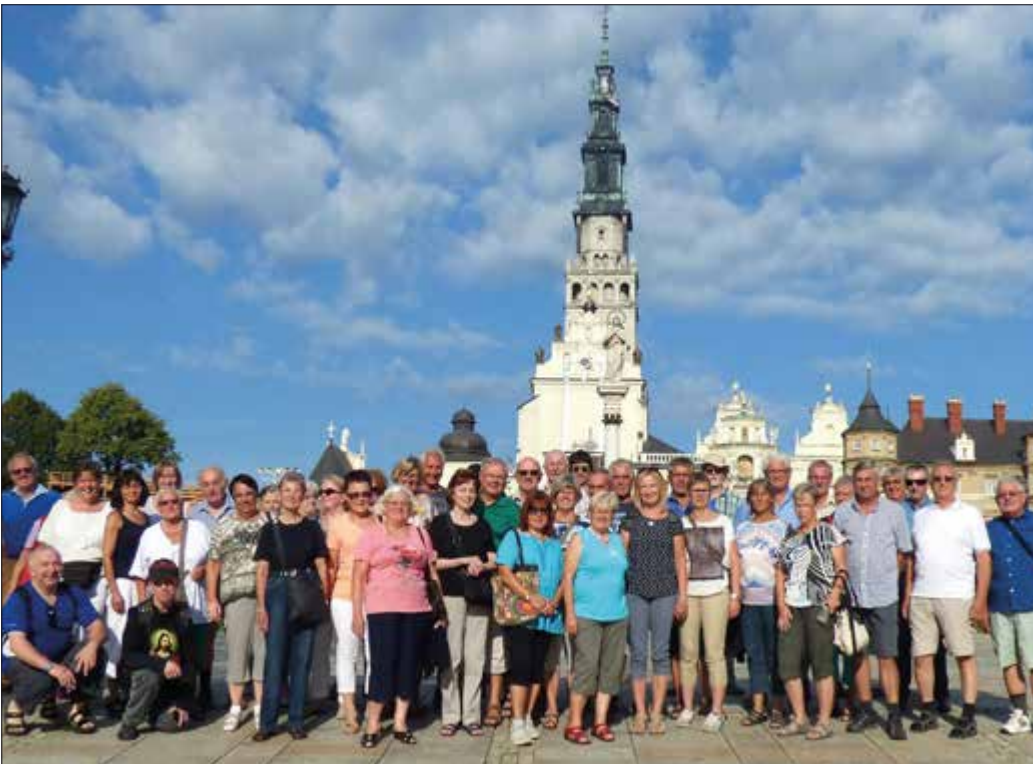
Foto: Die Reisegruppe vor dem Marienheiligtum Jasna Gora in Tschenstochau.

Gedenkstätte für Pater Maximilian Kolbe, der von den Nazis grausam ermordet wurde, besucht. Danach ging es durch die Masuren in den Norden des Landes nach Danzig, die alte Hansestadt an der Ostsee. Nächster Programmpunkt war das Marienheiligtum mit der Schwarzen Madonna von Jasna Gora in Tschenstochau. Nach einer überaus informativen Führung durch die Klosteranlage hielt Pfarrer Witek für die Pilgerschar einen Gottesdienst. Einen weiteren Höhepunkt der Reise bildete die wunderschöne Stadt Krakau. Bei einer geführten Stadtbesichtigung standen der Wawel (Residenz), die Altstadt und die Marienkirche mit dem berühmten gotischen Flügelaltar auf dem Programm. Auch für einen Einkaufsbummel in den ehemaligen Tuchhallen blieb noch Zeit, ehe es am nächsten Tag wieder zurück in die Heimat ging. Fazit: Eine überaus interessante Reise, wo vor allem die vielen gut erhaltenen und gepflegten Gotteshäuser sowie die Frömmigkeit der Menschen beeindruckend waren.