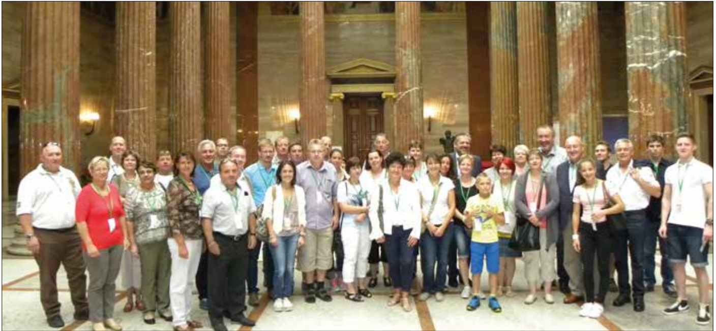
Der Gemeindeausflug 2016 führte die Teilnehmer heuer nach Wien in das Parlament, ins Schweizerhaus im Prater und auf den Küniglberg ins ORF-Zentrum.