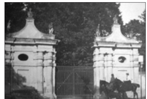
Das „Wiener-Tor“, der heutige Haupteingang zum Schloss Grafenegg, das „Krems-Tor“ und eine Aufnahme aus dem Jahre 1908 zeigt das sogenannte „Schwarze Tor“, das sich kurz vor der Ortseinfahrt Kamp befindet.