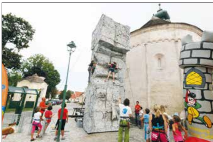
Wenn der Berg direkt in den Ort kommt. - Top Event am 19. August beim Kindersommer im benachbarten Hadersdorf. Die Sparkasse organisierte gemeinsam mit dem ÖTK Langenlois eine Riesen Kletterwand für den Hadersdorfer Kindersommer. Für die nicht so mutigen Kinder stand die Sparefrohluftübung zum Austoben bereit.