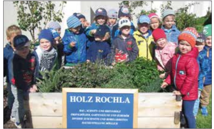
Kindergarten Engabrunn. - Zur großen Freude der Kinder hat die Firma Rochla aus Walkersdorf ein Kräuterbeet gespendet. Die Kinder finden viel Spaß am Gärtnern. Die geernteten Kräuter bereichern zukünftig die Kindergartenkost vitaminreich. Vielen herzlichen Dank dafür!