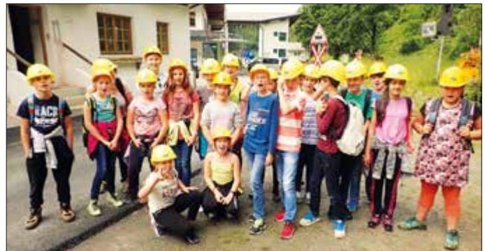
Kitzbühel wir kommen! - Seit einigen Jahren führt der Weg der ersten Klassen der NMS Grafenegg gegen Schulschluss nach Kitzbühel. Einige Wanderungen in der beeindruckenden Gebirgslandschaft und die Besichtigung eines Schaubergwerkes sind nur ein Teil des umfangreichen Programmes. Glück auf und ab ins Bergwerk!

Edith Klement: „Damit wird die von unseren Kunden gewohnte Handwerksqualität gesichert und gleichzeitig ein wertvoller Beitrag für die Zukunft unserer Gemeinde bzw. Region geleistet!“