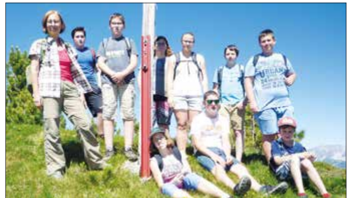
Innsbruckwoche der 4a und 4c. - Die Innsbruckwoche steht schon traditionell im Programm der vierten Klassen der Neuen Mittelschule zum Abschluss der vier gemeinsamen Jahre am Programm. Ob Gipfelsieg, Schisprungstadion oder Münzprägung in Hall. Die zahlreichen Möglichkeiten, die Innsbruck bietet, werden immer voll ausgeschöpft.