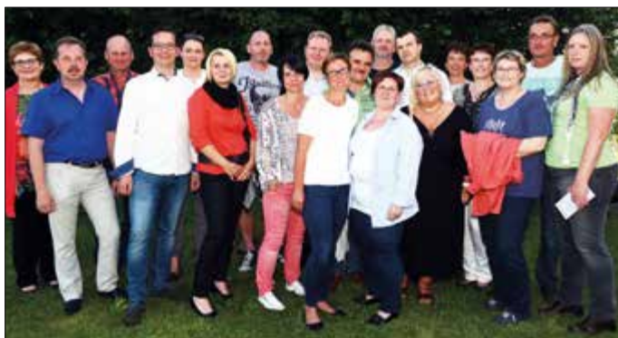
Viele Schulkameraden und Lehrer von heute und damals trafen sich beim gelungenen Schulfest der NMS Grafenegg Ende Juni in Etsdorf.