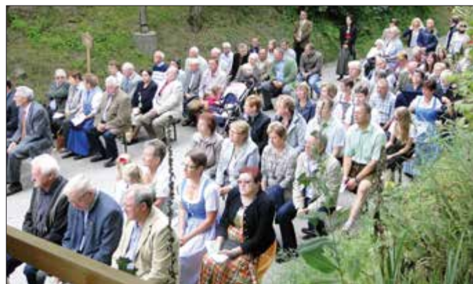
Ein Blick auf die zahlreichen Besucher der Feldmesse am 17. Juli im Rahmen des 35. Etsdorfer Kellergassenfestes.